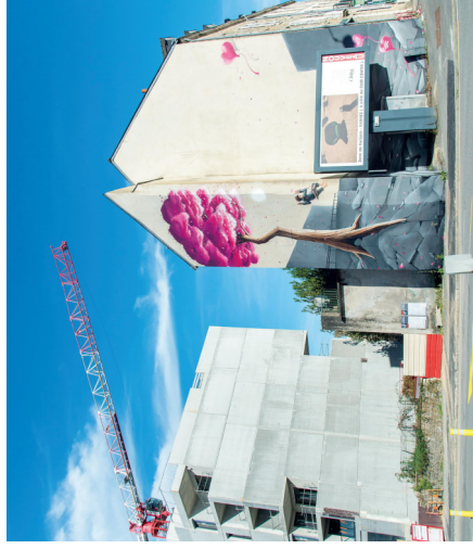
← Avant travaux Artiste fresque : Pakone

→ www.coudriet-architectes.fr