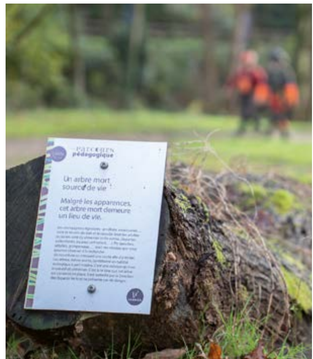
Des troncs ou des souches d'arbres sont volontairement laissés après un abattage, pour limiter l'impact sur la biodiversité.

Le nombre d'arbres plantés à Vannes en 2024. À ceux-là, s'ajoute le dispositif Un arbre, une naissance. Pour chaque nouveau-né vannetais, un arbre est planté.