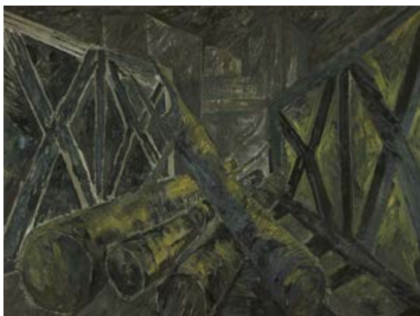
Peinture (ciment et glycéro sur toile) / 190 x 260 cm, de Rémy Thoirain.

→ Présences de Rémy Thoirain, samedis 22 février et 8 mars, de 15 h à 19 h. Gratuit Galerie Les Bigotes, 5 rue de la Bienfaisance