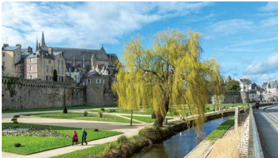
Le saule pleureur des remparts est âgé de 80 ans, mesure 16 mètres de haut et 4 m de circonférence.

Trois arbres remarquables sont recensés à Vannes. Le chêne vert de l'hôpital, le chêne de la rue Jérôme-d'Arradon et le saule pleureur du jardin des remparts. Classés au niveau national, ces arbres vivants exceptionnels, se distinguent par leur âge, leurs dimensions, leur forme ou encore leur histoire. Afin de les préserver, ces arbres rares sont classés d'intérêt national. Le label Arbre remarquable de France est décerné depuis 2000. En contrepartie les collectivités s'engagent à entretenir, sauvegarder et mettre en valeur l'arbre distingué, considéré comme patrimoine naturel et culturel. Plus de 700 arbres sont classés dans l'Hexagone, dont sept à Vannes et sa proximité.