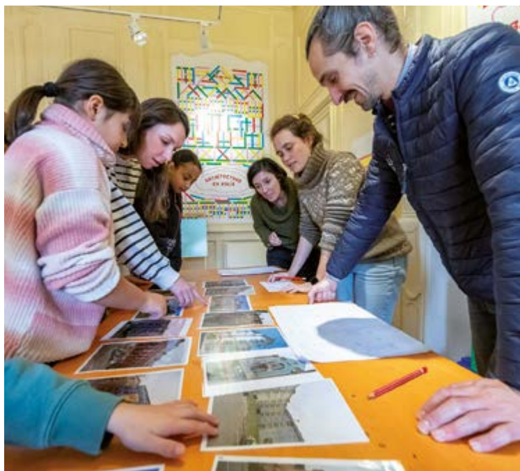
Des jeux permettent de toucher un large public sur la question des enjeux du territoire.

Le premier espace propose des défis bâtisseurs au jeune public, pour apprendre les bases de l'architecture et de la construction. Un jeu archi-frise permet aussi de dater dans l'ordre chronologique les édifices du territoire. Dans une deuxième salle, les jeux de plateau Plus belle ma ville et Cityzan traitent des questions liées à l'aménagement du territoire et à la transition écologique. Une version remasterisée du 1000 bornes, Rapido aborde le thème des mobilités, en trouvant le meilleur mode de déplacement pour arriver le plus rapidement chez soi. Ces jeux pour adolescents et adultes sont animés par des médiateurs pour mieux comprendre les défis du territoire. Quant aux amateurs de quiz, un jeu de plateau inspiré et adapté du célèbre Trivial Pursuit permet de tester ses connaissances sur l'environnement, le patrimoine, le climat, l'économie, la géographie et les loisirs au niveau de l'agglomération.