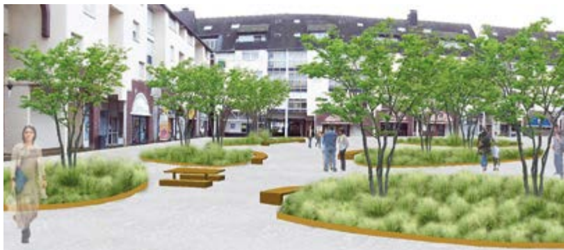
La place Fareham sera réalisée façon place-jardin, pour une livraison au mois de juin.

Très attendu des riverains, ce projet, dont la concertation a été réalisée avec les habitants, commerçants, associations et le conseil du quartier, prendra forme courant 2025.