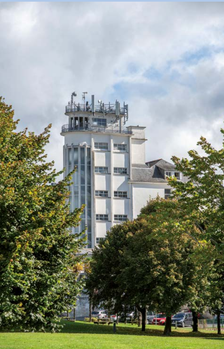
Cette tour des années 50, en béton, s'élève sur sept niveaux et abrite un escalier de secours pour évacuer en cas d'incendie.

En mai 1949, un incendie détruit en grande partie les bâtiments du collège-lycée privé de Vannes. Sa tour, aujourd'hui coiffée d'antennes-paraboles, a été pensée dès les premiers plans de reconstruction avec pour fonction : abriter un escalier de secours.