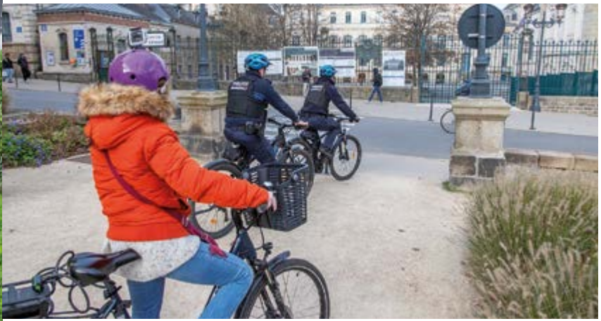
C'est parti pour le début de la patrouille : caméra sur le casque, on est bien équipé !