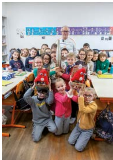
À l'école Nicolazic, les enfants ont pu toucher la torche, un moment unique.