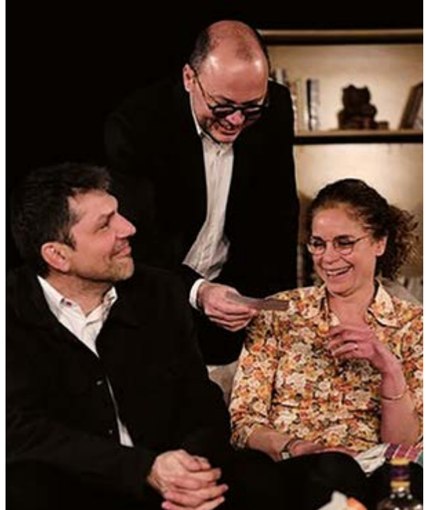
La troupe de théâtre Alterego joue la comédie « Le Prénom » dans la salle le Carré Alter Ego.

→ Billetterie en ligne: https://compagniealterego.fr