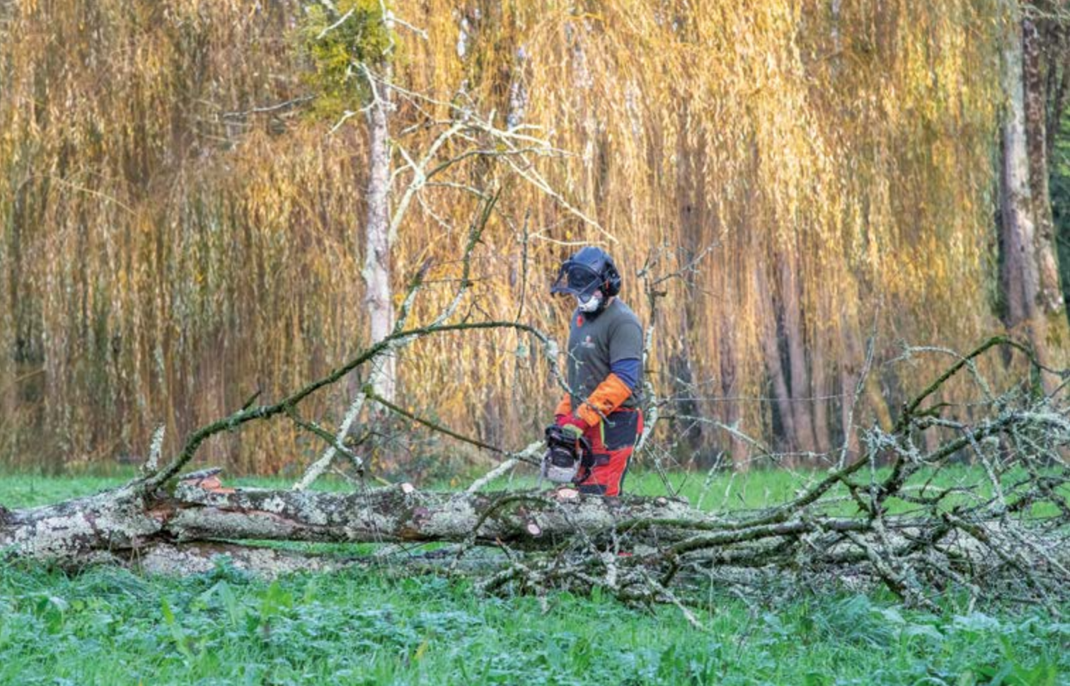
Les érables malades de la suie du parc du Rohan présentaient des risques de santé publique, avec la prolifération d'un champignon. Une fois abattus, ils ont été incinérés.