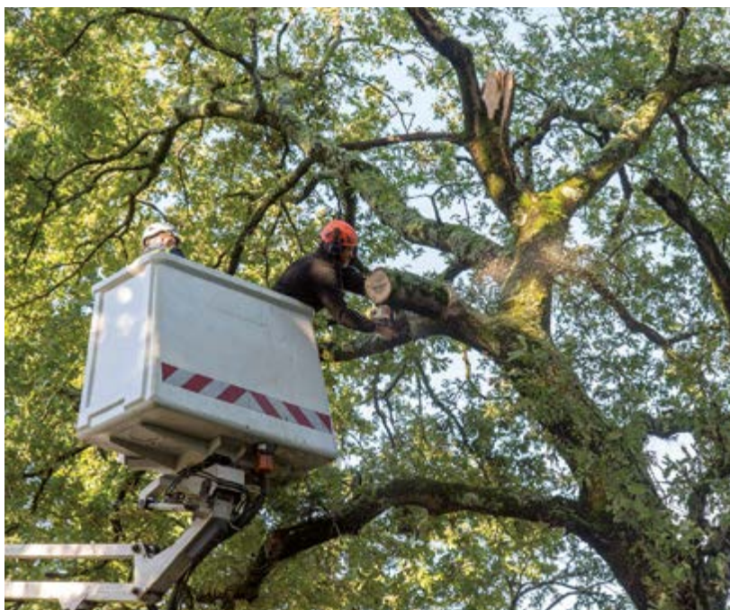
Au lendemain d'une tempête, l'équipe d'élagueurs de la Ville, intervient via une nacelle pour scier les branchers menaçant de tomber sur la voirie.

La sécurité est leur priorité, aussi quand une femme s'engage sur la route avec son bébé sous le bras pour le déposer à la crèche à 200 mètres, Anthony l'arrête tout de suite. La route a pourtant été fermée à la circulation. « Il faut veiller en permanence », juge