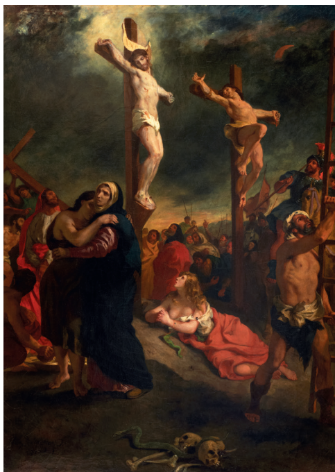
↑ Eugène Delacroix, Le Christ sur la croix , huile sur toile, 1835, collection musée des beaux-arts © Musées de Vannes.

Le musée des Beaux-Arts de Rouen pour son exposition intitulée Sous la pluie: peindre, vivre et rêver qui se déroulera du 11 avril au 20 septembre 2026, emprunte un tableau de Geneviève Asse (1923-2021) Pluie N°2 . À l'occasion d'une exposition consacrée au chanvre imaginée par le musée départemental de la Seine-et-Marne, deux tableaux de Jeanne-Marie Barbey (1876-1960) mettant en scène des tisserands en activité seront à voir à Saint-Cyr-sur-Morin, du 12 avril au 29 novembre 2026. Avant la fermeture du musée, le tableau d'Eugène Delacroix (1798-1863) Le Christ sur la croix voyagera une nouvelle fois pour figurer dans l'exposition Tintoret , au musée parisien Jacquemart-André, entre le 11 septembre 2026 et le 24 janvier 2027.