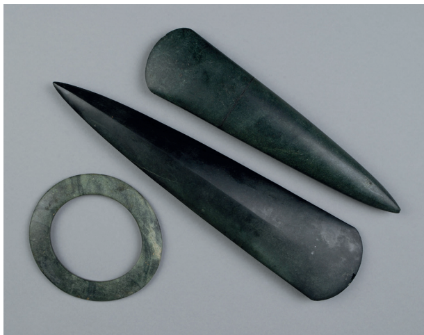
↑ Anneau-disque et haches polies du tumulus de Mané-er-Hroëck à Locmariaquer, roches alpines, Néolithique, Collection musée d'histoire et d'archéologie, ancien fonds Société polymathique du Morbihan

Un musée pour qui, pour quoi faire ? Autant de questions abordées dans l'exposition Les dessous des musées . Pédagogique, ludique et interactive, elle s'adresse à tous les publics : enfants, adultes, vannetaises et vannetais, touristes français ou étrangers... La scénographie met en valeur les collections des deux institutions de la ville de Vannes, le musée des beaux-arts et le musée d'histoire et d'archéologie, actuellement fermé pour rénovation.