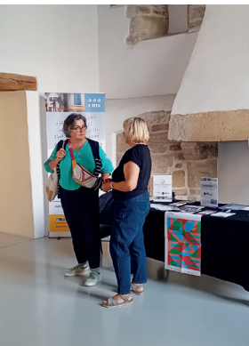
↑ Présence de l'association sur les Journées européennes du patrimoine

Vous aimez les musées. Vous souhaitez développer vos connaissances, participer, transmettre et partager votre intérêt pour la culture, rejoignez les associations des deux musées vannetais selon vos appétences et vos goûts.