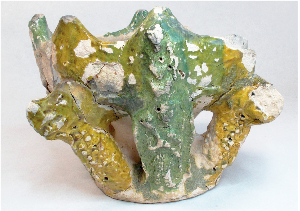
↑ Chauffe-plat en terre cuite presque complet, produit dans la région de Saintonge, et décoré de dragons et de personnages religieux, fin 15 e siècle, collection musée d'histoire et d'archéologie © Musées de Vannes.