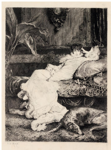
↑ Louis Monzies, Portrait de Sarah Bernhardt , 2 e moitié du 19 e siècle, gravure à l'eau-forte sur papier Collection musée des beaux-arts, La Cohue

FERMETURE DE L'EXPOSITION TEMPORAIRE SAISON 1 DU 20 AVRIL AU 22 MAI