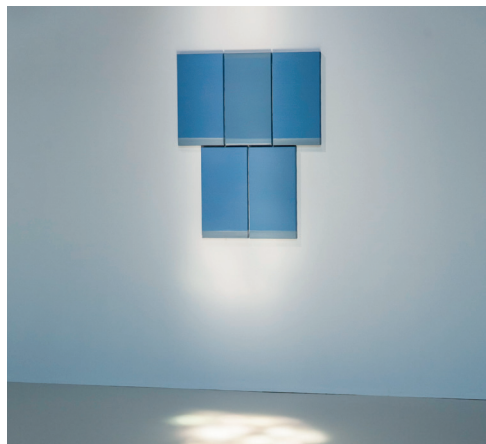
← Geneviève Asse, Stèle assemblage , 2003, huile sur toile, Collection musée des beaux-arts, La Cohue © Musées de Vannes.

Geneviève Asse est née à Vannes le 24 janvier 1923. Grande artiste connue et reconnue pour ses peintures aux nuances de bleu, elle a passé son enfance avec son frère jumeau Michel dans le manoir familial de Bonnervo près de Theix. Elle conserve tout au long de sa carrière un attachement à sa terre d'origine en installant un de ses ateliers sur l'Île-aux-Moines dans lequel elle revient régulièrement. Dès 1997, le musée des beaux-arts, La Cohue lui consacre une première exposition Le volume et le trait , puis une seconde en 2012 Geneviève Asse. Peintures . Suite à une donation de l'artiste en 2013, un espace dédié à son œuvre est créé au premier étage du musée, permettant encore aujourd'hui de plonger le regard dans ses bleus riches de subtilités et de lumière.