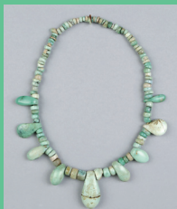
← Collier de perles et de pendeloques en variscite, Néolithique moyen, collection musée d'histoire et d'archéologie, ancien fonds Société polymathique Morbihan © Musées de Vannes.