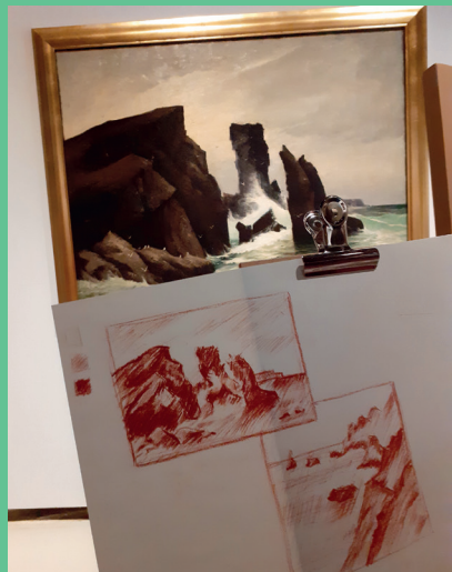
↑ Atelier dessin d'après les marines du musée

Les ateliers pratiques du musée vous proposent des expériences inédites où vous pourrez observer les œuvres sous un autre regard et expérimenter des techniques artistiques. Animés par des artistes confirmés et passionnés, ils partagent avec vous leur savoir-faire unique.