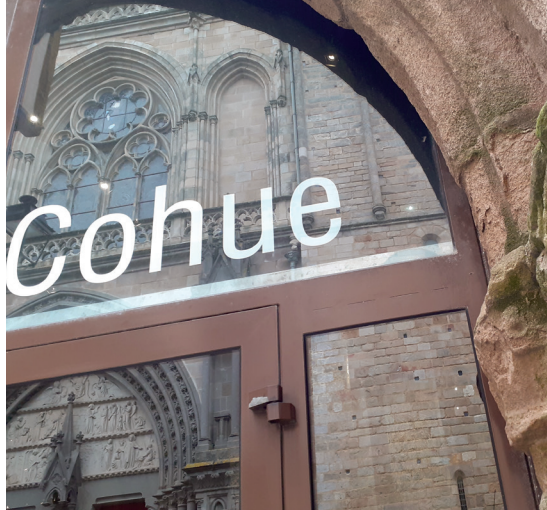
↑ Détail de l'entrée du musée des beaux-arts, La Cohue

Les peintures aujourd'hui exposées dans l'espace latéral nord de La Cohue correspondent à une sélection opérée au sein de la thématique liée à la Bretagne: portraits, paysages, scènes de genre. Issu du fonds d'arts graphiques, un ensemble d'estampes et de dessins diversifie le parcours de visite.