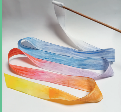
↑ Bâton de danse de l'atelier Danse des couleurs