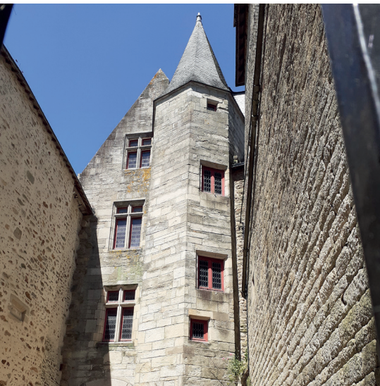
↑ Vue extérieure du Château Gaillard