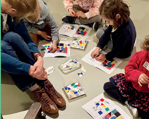
↑ Visite-atelier Les couleurs sens dessus-dessous

Le temps des vacances rime avec loisirs, ateliers créatifs et découvertes pour vous ? Le musée attend les enfants pour les transporter dans le monde de l'imaginaire et de l'émerveillement artistique. Selon les âges ou les goûts, choisissez la visite-atelier adaptée à votre enfant.